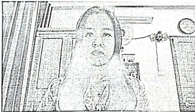
Hình 1: Hình ảnh Webcam trên máy tính

- Sinh viên/học viên cần ăn mặc chỉnh tề, giữ trật tự khi làm bài thi, để thẻ sinh viên/học viên và CCCD/CMND trên mặt bàn, thuận lợi cho CBCT kiểm tra/chụp ảnh khi được yêu cầu. Điều chỉnh Webcam để quay rõ khuôn mặt và không gian phía sau sinh viên/học viên như Hình 1